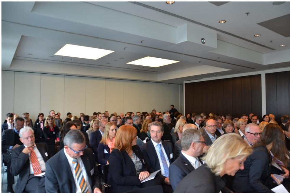
130 Unternehmer und Personalverantwortliche besuchten das 3. deutsche arbeitsmarkt forum

Über 130 Gäste aus Baden-Württemberg und weit darüber hinaus kamen nach Neckarsulm, um wichtige Impulse aus Wissenschaft und Praxis für ihren eigenen Arbeitsalltag mitzunehmen.