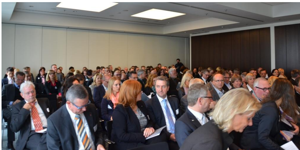
130 Unternehmer und Personalverantwortliche besuchten das 3. deutsche arbeitsmarkt forum

Über 130 Gäste aus Baden-Württemberg und weit darüber hinaus kamen nach Neckarsulm, um wichtige Impulse aus Wissenschaft und Praxis für ihren eigenen Arbeitsalltag mitzunehmen.